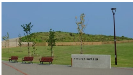
公園整備イメージ (アイランドシティはばたき公園)