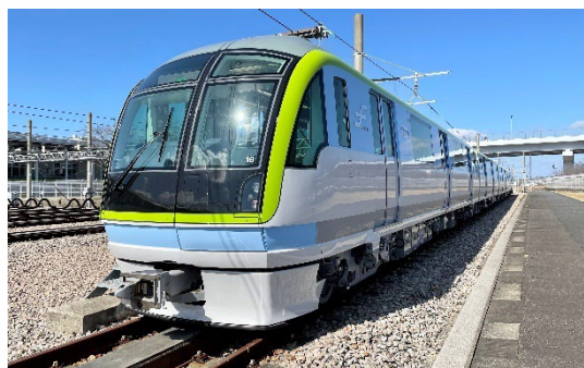
地下鉄事業イメージ