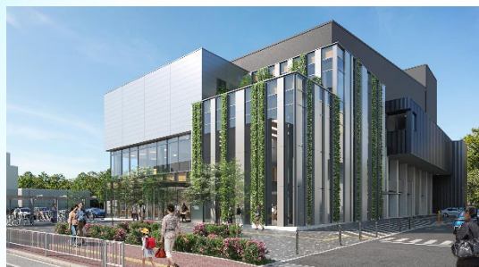
中央市民センター完成イメージ