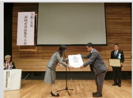
令和7年度 福岡市食品衛生大会