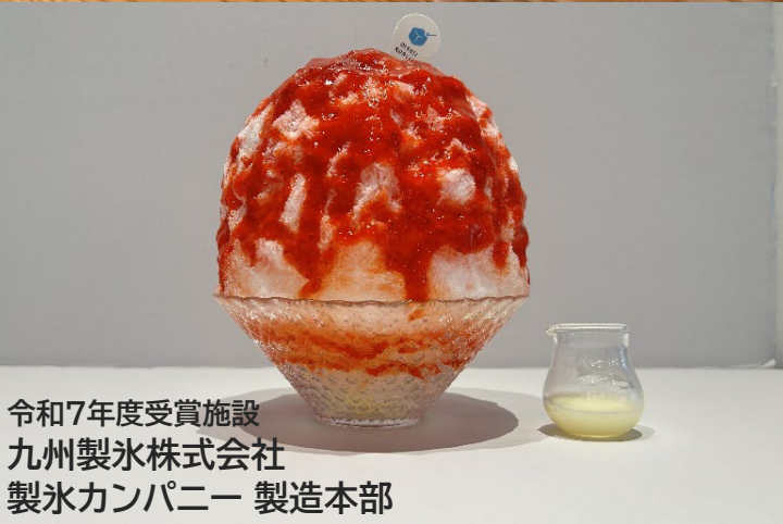
令和7年度受賞施設 九州製氷株式会社 製氷カンパニー 製造本部