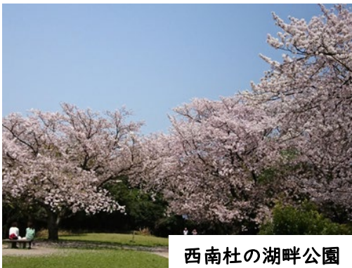
西南杜の湖畔公園