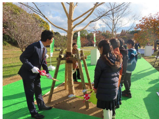
令和7年度植樹式実施状況