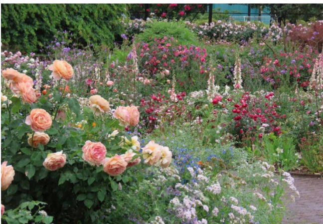
バラと宿根草のガーデン