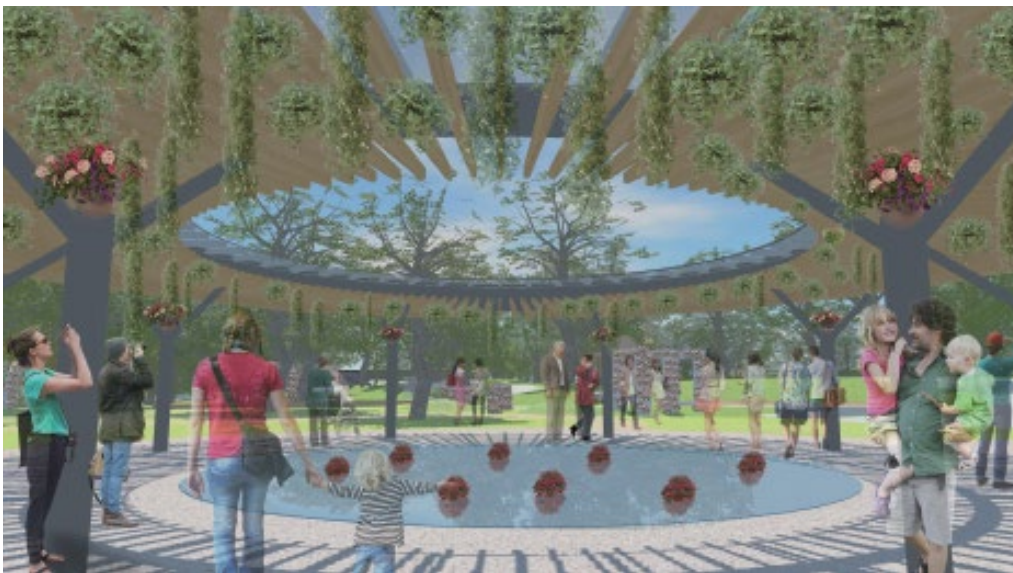
緑と水盤のパーゴラ「サーキュラーテラス」