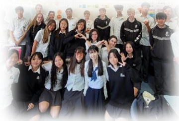
第3回 福岡市姉妹都市委員会 ホームステイプログラム(ニュージーランド)

この度、令和8年の夏に派遣する訪問団員(高校生)の募集を開始しますので、広報のご協力をいただきますようお願いいたします。