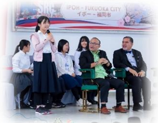
第26回福岡・イポー 青少年訪問団派遣事業