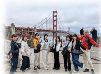
第49回福岡・US オークランド 青少年訪問団派遣事