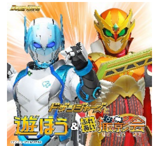
オーガマン(左) フクオカリバー(右)

場 所: マリンメッセ福岡A館 屋内 時 間: 12時30分～13時00分[Part1] : 14時30分～15時00分[Part2]