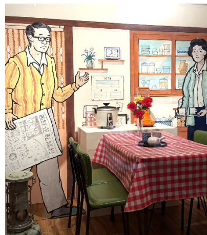
(参考)常設展示室「高度経済成長の時代」の団地での暮らしを紹介するコーナー