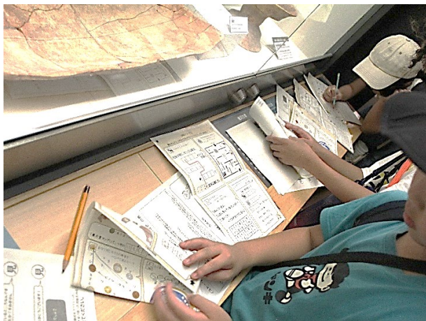
R6年度の謎解きイベントの様子(内容は異なります)