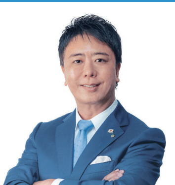
福岡市長 高島 宗一郎