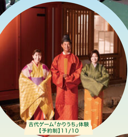
古代ゲーム「かりうち」体験 【予約制】11/10