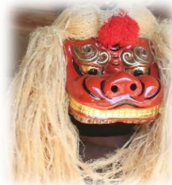
宇田川原豊年獅子舞