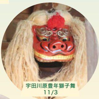
宇田川原豊年獅子舞 11/3