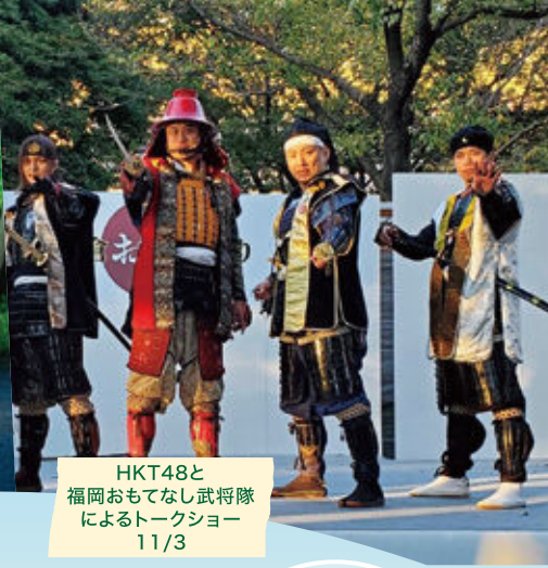
HKT48と 福岡おもてなし武将隊 によるトークショー 11/3