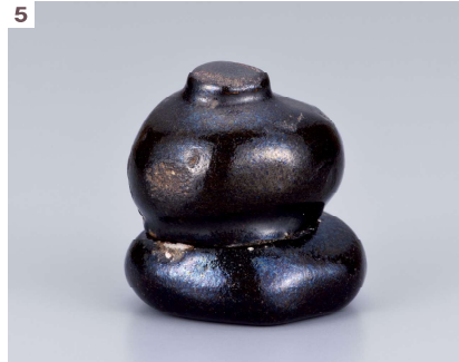
1 高麗雨漏茶碗 朝鮮王朝時代 福岡市美術館蔵 ※本チラシ表面の茶碗 / 2 桃時絵細棗 江戸時代 個人蔵 / 3 白呉州獅子蓋香伊 明時代 個人蔵 / 4 松平不昧作茶杓 銘「曲直」 江戸時代 個人蔵 / 5 本阿弥光悦作 瓢箪香合 江戸時代 北陸大学蔵 (後期展示) / 6 小堀宗中筆 二行書 江戸時代 個人蔵