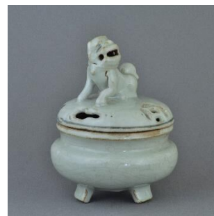
《白呉須獅子蓋香炉》 明時代 16～17世紀 個人蔵

吉村観阿(1765-1848)は、江戸時代後期、茶の湯道具の“目利き”で人生を切り拓いた人物です。大名茶人・松平不味や新発田藩主・溝口家に出入りし、蔵品の鑑定や数寄道具の取り次ぎで活躍。そうした実績から観阿の箱書きはそれ自体が価値となり、現代に至るまで高く評価されています。本展は観阿が大名茶人らに取り次いだ茶道具や、江戸における様々な文化人との交流を物語る資料を展観し、知られざる目利きの足跡とその美意識にせまります。