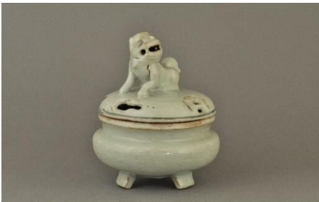
③白呉州獅子蓋香炉