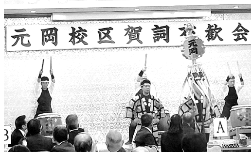
元岡分団の纏の様子