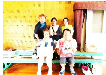
6区自治会の選手の皆さん