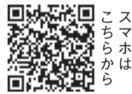
スマホはこちらから

問西区まるごと博物館推進会事務局(区企画振興課内) ☎895-7032 ㊚885-0467