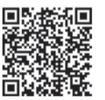
スマホはこちらから