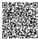
スマホはこちらから

その他の催しは、区役所や各公民館等で配布しているリーフレットや区ホームページ(「西区西祭」で検索)をご覧ください。問い合わせは、西祭実行委員会事務局(区企画振興課内) ☎895-7033 ㊚885-0467)へ。