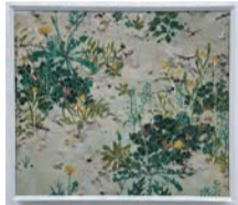
昨年の優秀賞の作品(日本画部門)

※11月4日(月・休)午後1時からミュージアムホールで表彰式を行います。終了後に審査員が出展作品について解説するギャラリートークもあります。