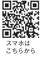
スマホはこちらから

初めて母親になった人のための教室です。母親同士の交流会もあります。 期10月28日(月)午前10時～11時30分 所区役所別館1階講堂 関今年7～8月生まれの子ども(第1子)とその母親 定抽選で18組 料無料 申電話で区地域保健福祉課(☎895-7080 ☒891-9894)へ。10月18日(金)まで受け付け。右コードからも申し込み可。