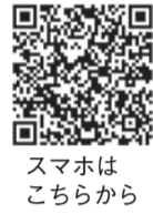
スマホはこちらから

楽しみながら健康づくりに取り組めるポイントラリーを実施します。健(検)診を受けたり、10月中に行われる健康づくりイベントに参加したり、ウォーキングをしたりしてポイントをためると、抽選で景品がもらえます。ラリーの台紙は区役所別館1階の受付窓口や西部出張所等に設置しています。詳細は区ホームページ(「西区健康応援」で検索)をご覧ください。