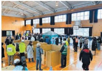
区総合防災訓練の様子

災害時に地域住民による自主防災活動が円滑に行えるよう、地域が実施する各種防災訓練や研修会、避難に手助けが必要な人の個別避難計画作成を支援します。