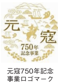
元寇750年記念事業 事業ロゴマーク

自分が住む地域に誇りを持つよう、地域の皆さんが主体的に行う事業を支援します。その一つとして、元寇から750年となる今年、シンポジウムを行います。