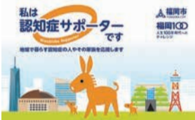
養成講座を修了すると「サポーターカード」がもらえます

認知症の人とスムーズにコミュニケーションを取るためのケア技法「ユマニチュード®」の啓発や、認知症の人を地域で見守り支えるサポーターを養成する講座を開催します。