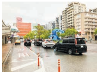
浜駅前前の混雑状況

夜間や雨天時に混雑する浜駅前広場で、公共交通機関にスムーズかつ安全に乗り継ぎできるように改良を進めるとともに、橋本駅の駐輪場の整備に着手します。