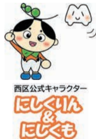
西区公式キャラクター にしりん & にしくも

SNSや市政だより、区が主催するイベントなどで、区公式キャラクターの「にしりん＆にしくも」が西区の宝をはじめとする西区の魅力を区内外に発信します。