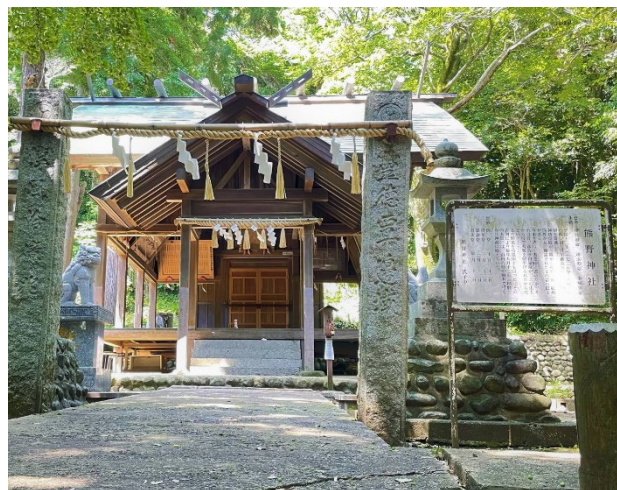
今山の山頂付近にある熊野神社

Mt. Imayama is about 80 meters high located west of Imazu Bay, with its summit and base designated as a conservation area. Near the summit stands Kumano Shrine which is surrounded by numerous preserved trees, including Japanese chinquapin, ginkgo, and Japanese hackberry. This area is also one of the few places where Japanese native species, Kansai dandelion and white-flowering Japanese dandelion, coexist in clusters.