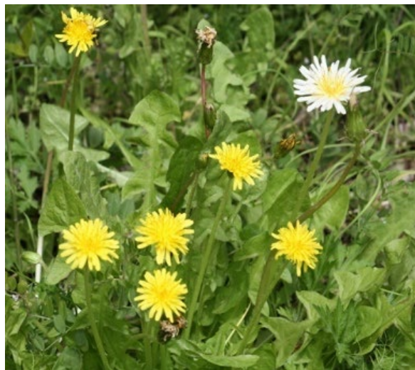
今山で見ることができる珍しいタンポポ

今山は今津湾の西側に位置する高さが約80mの山で、その山頂及び山麓一帯が保全地区となっています。山頂近くに熊野神社があり、その周辺にスダジイやイチョウ、エノキ等の保存樹が多数あります。また、日本の在来種の「カンサイタンポポ」と「シロバナタンポポ」が一緒に群生している数少ない場所でもあります。