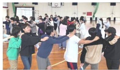
青少年育成連合会

2月28日(土)、春吉中学校体育館にて玉川小学校から6年生24名が参加し、レクリエーションやドッジビーを行いました。 他校区の新たな友達ができるきっかけになり、楽しい時間を過ごせたのではと思います。