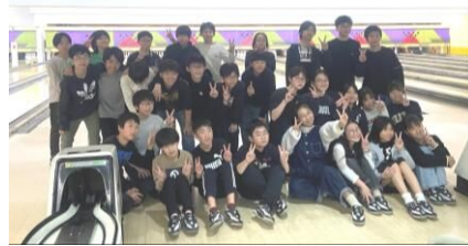
子ども会育成連合会

2月14日(土)、子ども会のポーリング大会を行いました。 1ゲーム目は通常のゲーム、2ゲーム目はお菓子がもらえるゲームで白熱しました。 小学生最後の子育連行事で良い思い出ができたと思います。