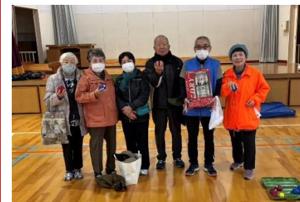
【Cコート1位】 栄Bチーム