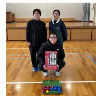
【Bコート1位】 五十川Bチーム