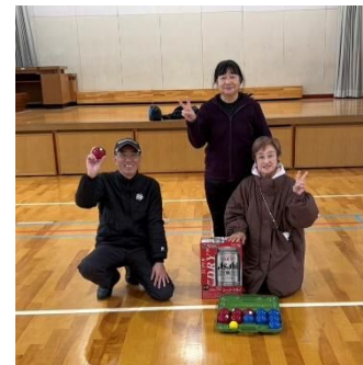
【Aコート1位】 五十川Aチーム

令和7年12月14日(日)、宮竹小学校体育館において校区ペタンク・ダーツ大会が行われました。当日は87名の参加があり、大いに盛り上がりました。 ご参加いただいたみなさま、ありがとうございました。 =ペタンク(団体戦)の結果=