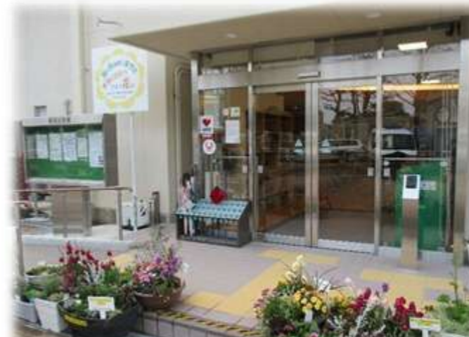
公民館の玄関に春がやって来ました