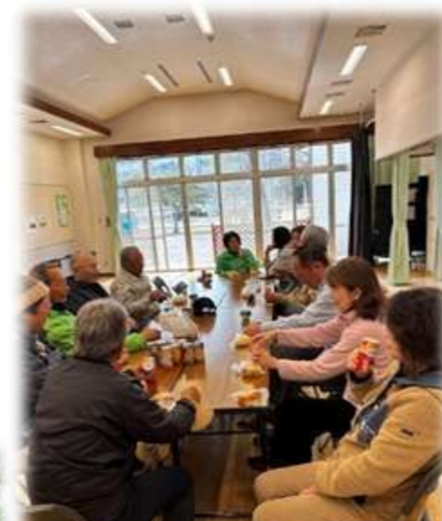
花植え終了後はお茶を飲みながら交流しました

「じんけん新聞 37号」を「公民館だより4月号」と併せて配布しております。どうぞご覧ください。