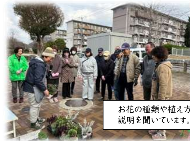
お花の種類や植え方の説明を聞いています。