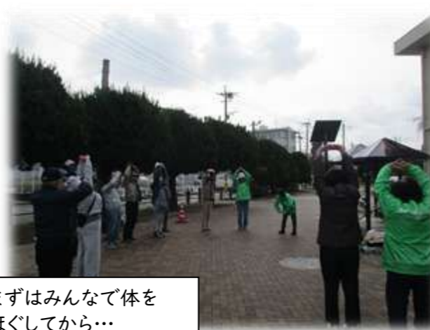
まずはみんなで体をほぐしてから...

長住校区人権尊重推進協議会では毎年、「花いっぱい運動」に取り組んでいます。 今年度は3月7日(土)に行い、長住公民館の玄関が花でいっぱいになりました。風がちょっと強い日でしたが澄んだ青空のもとでの作業に春の兆しを感じることができました。