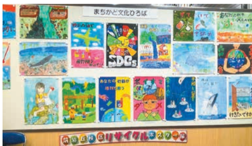
区役所に掲示されたポスター

このリサイクルポスター展は、環境にやさしい都市の実現を目指して、環境の保全・創造に高い水準で貢献していると評価され、「福岡市環境行動賞」の学校部門の、優秀賞を受賞しました。