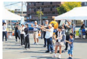
フィットネス体験