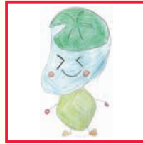
宇治野 夢弥(うじのことみ)さん(11歳)作