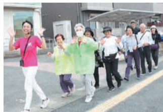
昨年度開催された健康づくりのイベント

健康づくりをサポートするため「若久通りウォーキングコース」を活用し、周辺地域や大学、企業と連携して、健康や食育に関するイベントを開催します。