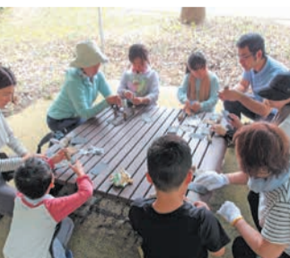
オリジナルスプーン作り

長丘中学校前の広場に集合・解散 小学生(4年生以下は保護者同伴必要) 各回抽選20人 無料 飲み物、汗を拭くタオル、帽子、虫除け、軍手、雨合羽(雨天時) ※長袖長ズボン、ハイソックス等(くるぶしがでない靴下)、歩きやすい靴で参加してください。