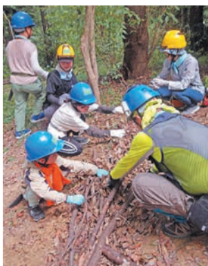
落ち葉や枝を集めて土留め作り体験

鴻巣(こうのす)山で自然観察や森の保全体験、間伐材を使ったオリジナルスプーン作りなどを行います。身近な自然と触れ合い、自然環境を守ることの大切さを親子で楽しみながら学んでみませんか。