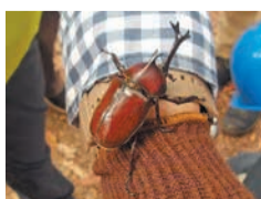
カブトムシを見つけました