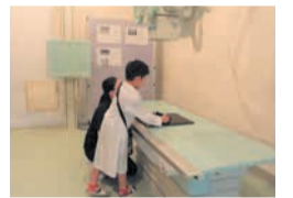
昨年度の「こども大学」の様子

区内の大学や企業と連携し、専門性やノウハウを生かしたイベントや出前講座を開催します。小学生向けの体験講座「こども大学」も実施します。