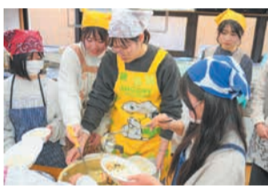
地域の人と一緒に外国の料理を作るイベント

また、地域での交流イベントの実施に向けた支援を行い、地域住民と外国人居住者との相互理解の促進による多文化共生社会の実現を目指します。