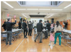
昨年度開催された交流イベント

区の多文化共生施策に参画する外国人をパートナーとして登録するほか、外国人と日本人のワークショップを実施し、日本での生活ルールを分かりやすく伝える方法などを一緒に考えます。