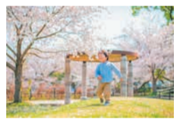
前回のフォトコンテストグランプリの作品

「桜」をテーマにした短歌を募集する「桜原桜賞」や「桜原桜フォトコンテスト」などのイベントを行うほか、来年3月に開催される「フクオカフラワーショー2026」と連携した創作スイーツイベント「フラワーマルシェ」を開催します。