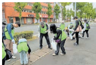
ふくおかポイントを活用した塩原校区の「53(ごみ)あつめ大作戦」

地域活動に参加した人に、公共施設の利用券などの特典と交換できる「ふくおかポイント」を付与する事業を希望する校区で実施し、地域活動の活性化を支援します。