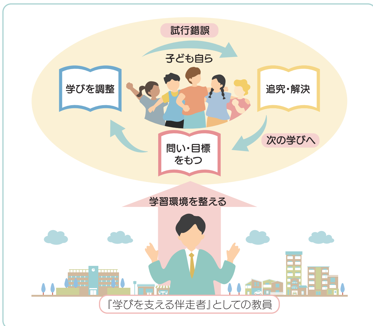
子どもを主体とした学びのイメージ図

そのためには、教員は学習者主体の視点を意識し、子ども一人ひとりの可能性を引き出し、学びを支える伴走者としての役割を果たすことが求められます。学びに必要な人や空間・時間などを整えていくことで、子どもを主体とした学びを推進します。