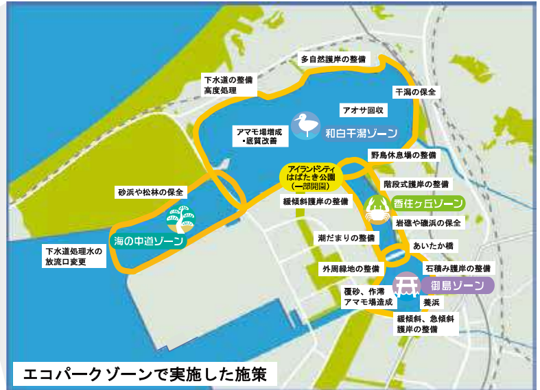
エコパークゾーンで実施した施策

The area including the sea and the coast around Island City located in the eastern part of Hakata Bay