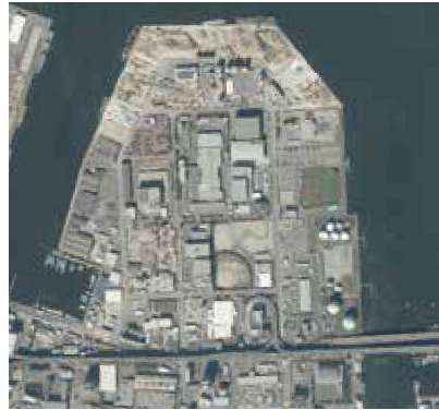
■係留施設 Mooring Facility

Construction materials and LPG (liquefied petroleum gas) are handled at this facility.