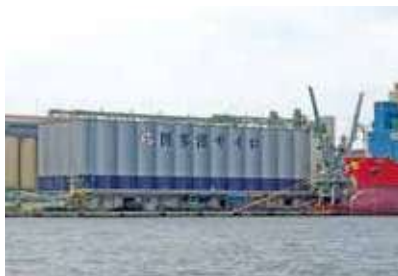
■穀物サイロ Grain silo

[Berth] 8 Water supply facilities [Shed] 14 General cargo sheds: 35,944m 2 [Cargo Handling Equipment] 2 Pneumatic unloaders: 400t/h 1 Mechanical unloader: 400t/h Freight sorting yard: 10,835m 2 Open storage yard: 15,421m 2