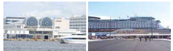
■博多港国際ターミナル Hakata Port International Terminal ■中央ふ頭クルーズセンター Cruise Center

A Multifunctional Wharf with an International Terminal, a Cruise Center, Large Convention Facilities and Sophisticated Warehouses Chuo Wharf functions as an advanced distribution hub with sophisticated warehouses and other facilities, MICE (Meetings, Incentives, Conferences and Exhibitions)-related facilities such as Fukuoka International Congress Center, exhibition centers, and halls are also concentrated, and many international conferences and other events are held here. Hakata Port International Terminal and Cruise Center are crowded with passengers for cruise ships and passenger ships to Busan.