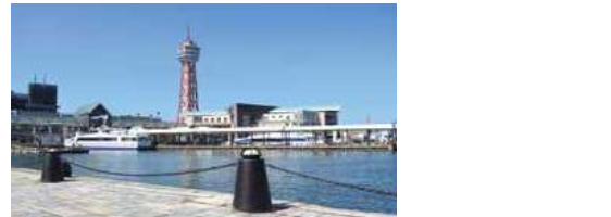
■博多ポートタワーとベイサイドプレイス博多 Hakata Port Tower and Bayside Place HAKATA

Enhancement of Vibrant Exchange Hub Hakata wharf has been developed as a vibrant exchange hub including Hakata Port Tower, Hakata Port Bayside Museum, and Bayside Place HAKATA with a passenger terminal and restaurants.