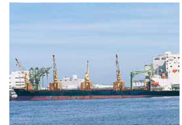
■穀物専用船 Grain carrier