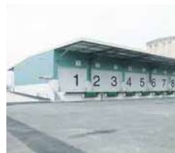
■上・中(左) — 東京定期航路のRORO船 Top & Middle(left): Ro/ro vessels on liner routes to Tokyo ■中(右) — 敦賀定期航路のRORO船 Middle(right): Ro/ro vessel on liner routes to Tsuruga ■下 — RORO ターミナル上屋 Bottom: Ro/ro terminal shed