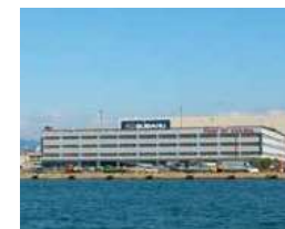
■立体車両野積場 Multistory automobile storage facility