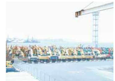
■輸出用建設機械 Construction machinery for export