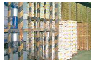
■青果上屋 Fruit & vegetable shed