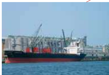
須崎ふ頭 SUZAKI WHARF