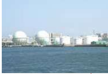
東浜ふ頭 HIGASHIHAMA WHARF