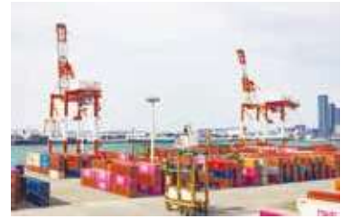
香椎パークポート KASHII PARK PORT