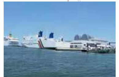
中央ふ頭 CHUO WHARF