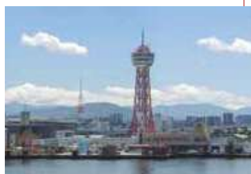
博多ふ頭 HAKATA WHARF