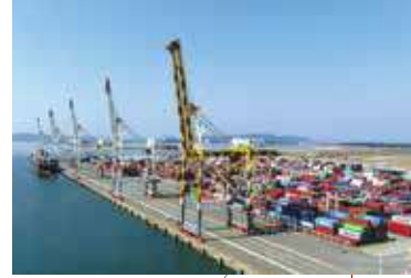
アイランドシティ ISLAND CITY