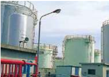
荒津地区 ARATSU AREA