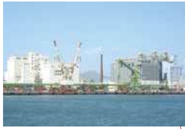
箱崎ふ頭 HAKOZAKI WHARF

A land area that functions as an integral part of the port limits (waters) for smooth management and operation of the port.