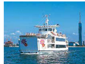
■フラワーのこ (能古島航路) Flower Noko (Nokonoshima Route)

博多湾内観光航路は、貸切船で、博多湾内を周遊する航路となっています。ツアーやイベント等にも幅広く利用され、市街地や博多湾の風景を、船上から楽しむことができます。Utilizing the Attractiveness of Ferries and the Port "Sightseeing Route within Hakata Bay" The Hakata Bay Sightseeing Route is a chartered ferry service that circles Hakata Bay. The route is widely used for tours and events, and allows passengers to enjoy the scenery of the city and Hakata Bay from the ship.