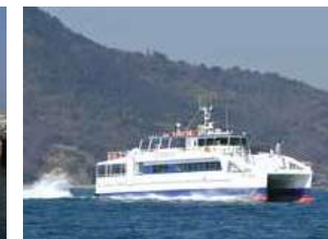
■ゆうなみ (共通予備船) Yunami (substitute vessel in common use)