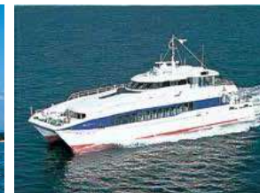
■きんいん1 (志賀島航路) Kinin1 (Shikanoshima Route)