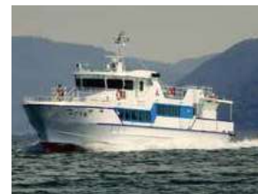
■みどり丸 (玄界島航路) Midori Maru (Genkaijima Route)