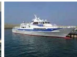
■ニューおろしま (小島島航路) New Oroshima (Oronoshima Route)