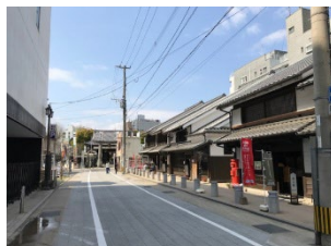
歴史・文化に配慮した道路整備