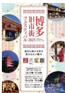
博多旧市街 フェスティバルの開催