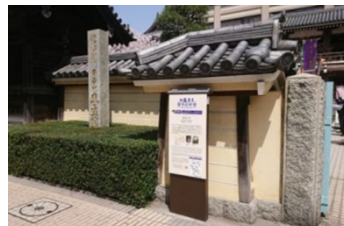
観光案内板の整備