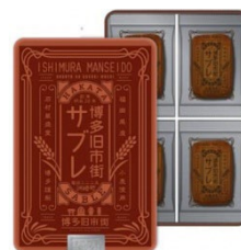
観光商品のPR (博多旧市街セレクト)