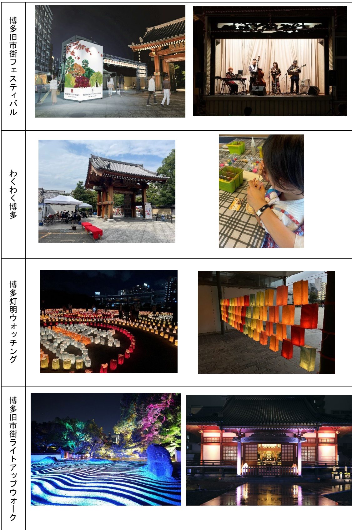
写真 イベント開催状況