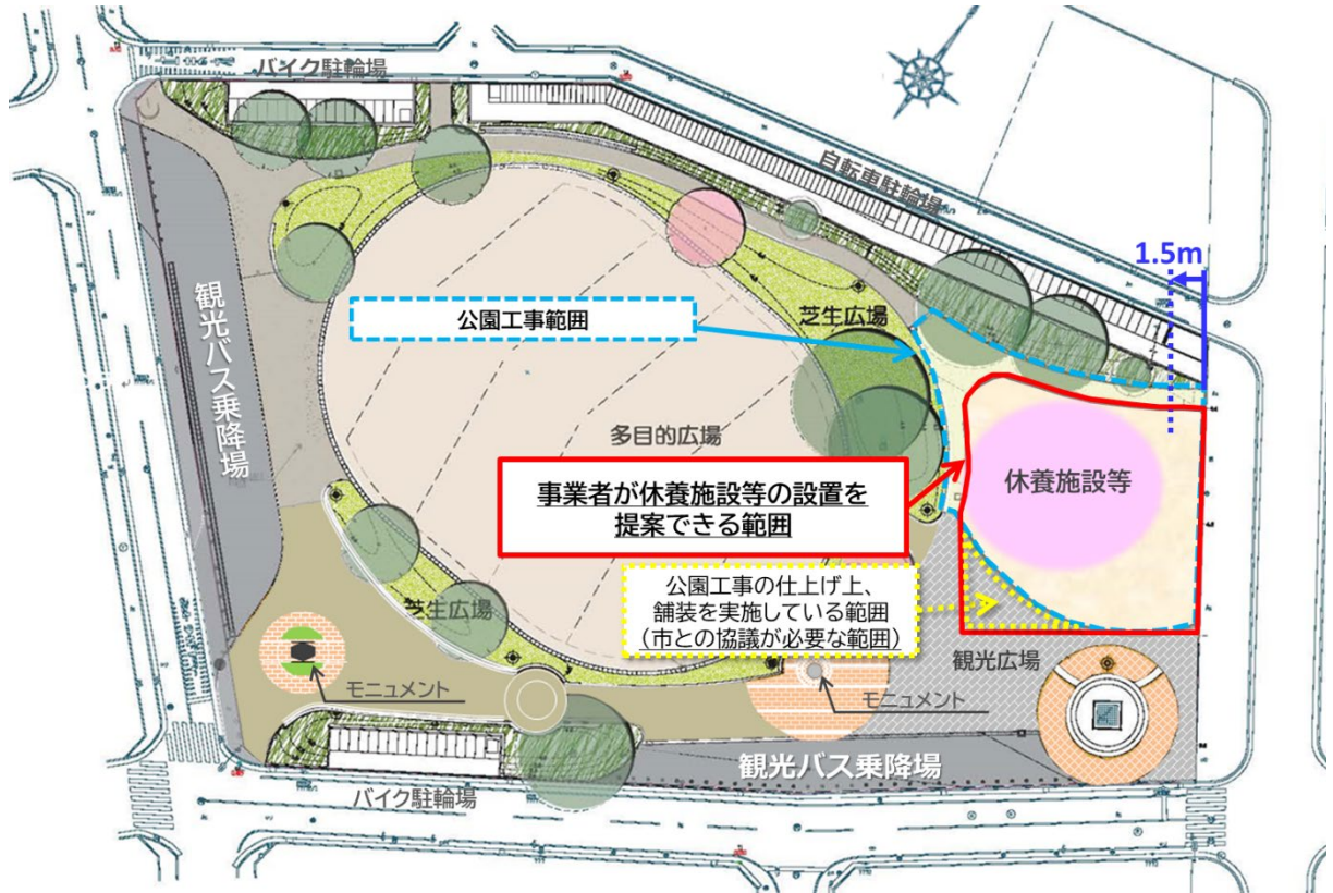
図1 休養施設等の設置を提案できる範囲