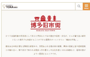
市観光情報サイト「よかなび」 による情報発信