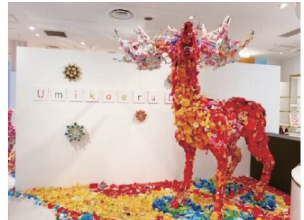
ゴミを題材にしたアートイベント