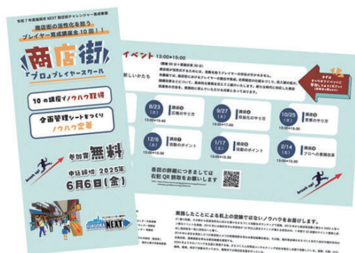
勉強会のリーフレット