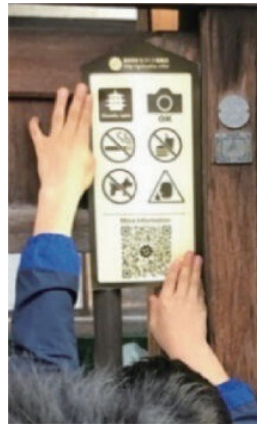
ピクトグラム 案内看板の設置