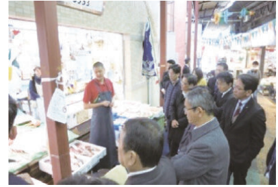
商店街の強みを把握するため モニター(消費者)による調査を実施