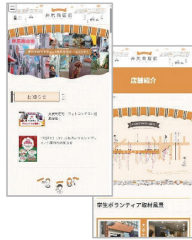
ホームページの制作