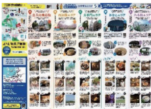
地域観光資源の案内・PR