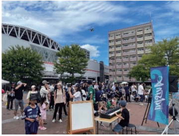
出店やステージイベントによる 祭りの開催