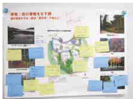
朝廣・高取研究室