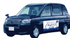
ユニバーサルデザインタクシー (乗客定員4人)