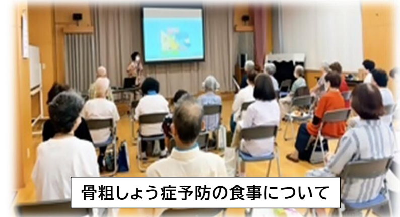
骨粗しょう症予防の食事について