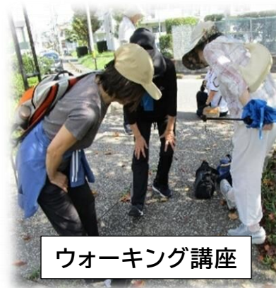
ウォーキング講座