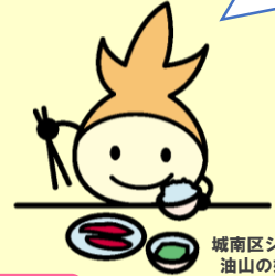
城南区シンボルキャラクター 油山の妖精「ニッコリン」