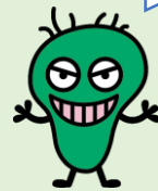
城南区シンボルキャラクター 0-157の王様「ワルもん」