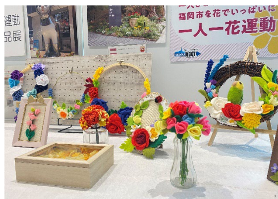
展示スペースの展示例