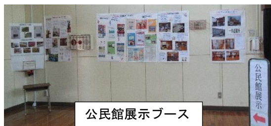
公民館展示ブース

また、体育館後方の公民館ブースでは、主催事業・サークル紹介・イベント等の広報活動を行い、地域の方々が気軽に立ち寄れる公民館をPRしました。