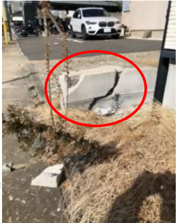
相手方施設設備損傷写真