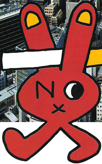
路上禁煙シンボルキャラクター 「スーナちゃん」

市内全域で歩行中や自転車乗車中に喫煙するのはやめましょう。特に、路上禁煙地区では道路上での喫煙が禁止されています。公共の場所での喫煙は、他人に迷惑をかける恐れがあります。周囲の安全に十分配慮し、灰皿のある場所で喫煙しましょう。