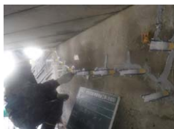
②【エポキシ樹脂材 注入】