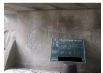
③【ひび割れ注入工 完了】