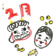
イラスト:草ヶ江小学校 5年