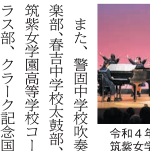
令和4年「音楽と演芸のつどい」筑紫女学園高等学校の演技

また、警固中学校吹奏楽部、春吉中学校太鼓部、筑紫女学園高等学校コーラス部、クラーク記念国際高等学校演劇部、子ども会なども出演します。お楽しみ抽選会では、花や菓子のセットが当たります。