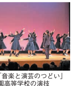
令和4年「音楽と演芸のつどい」筑紫女学園高等学校の演技

また、警固中学校吹奏楽部、春吉中学校太鼓部、筑紫女学園高等学校コーラス部、クラーク記念国際高等学校演劇部、子ども会なども出演します。お楽しみ抽選会では、花や菓子のセットが当たります。